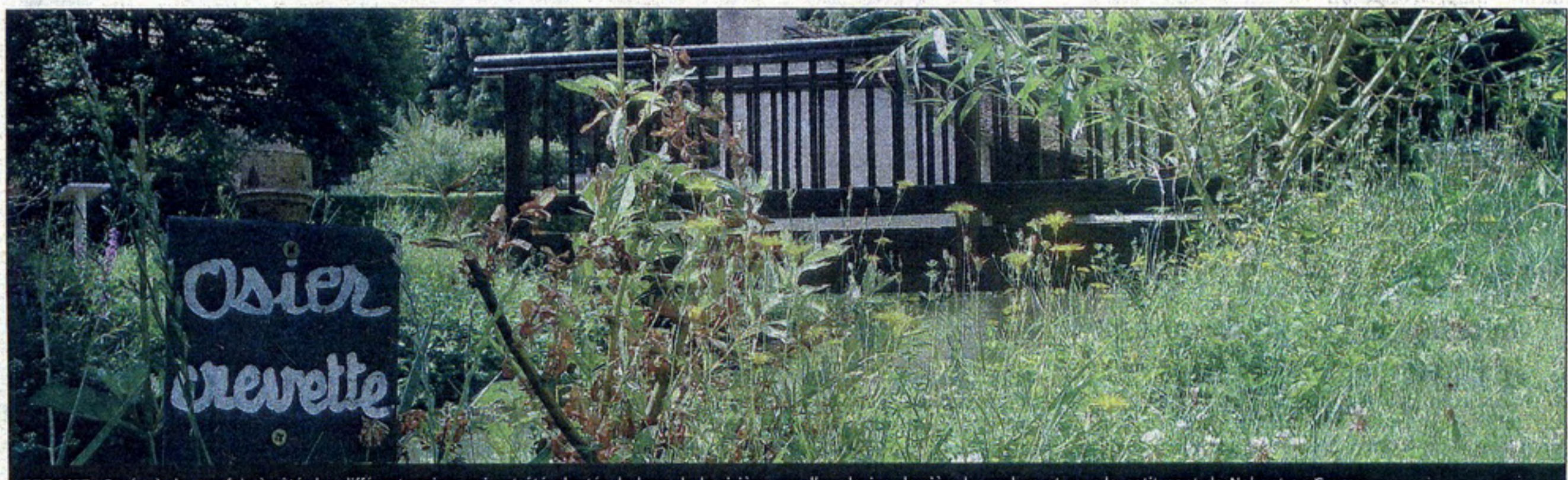
ARDOISE. Posée à chaque fois à côté des différents osiers qui ont été plantés, le long de la rivière, que l'on devine derrière la verdure et sous le petit pont de Nohant-en-Graçay.